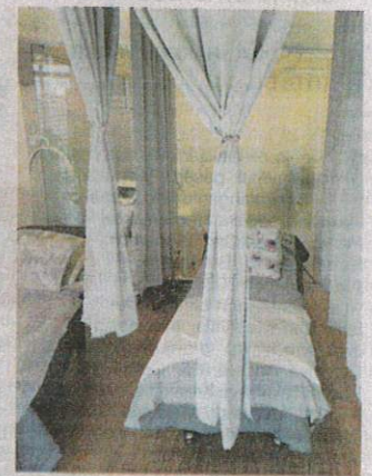
Ruangan bilik di sediakan dipercayai bagi pelanggan untuk mendapatkan khidmat perubatan estetik.

Dr Azfar berkata, harga rawatan ditawarkan antara RM200 hingga RM20,000 bergantung jenis pakej yang diambil pelanggan.