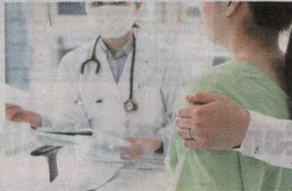
Berdasarkan siri laporan pelbagai media dan pengakuan beberapa doktor sendiri, budaya buli juga berlaku dalam kalangan profesional termasuk doktor. - Gambar hiasan

“Budaya membuli dalam kalangan pengamal perubatan terutama membabitkan doktor sangat membimbangkan, namun sukar untuk mengetahui