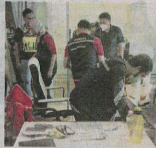
Serbuan premis pusat kecantikan haram di Jalan Sentul, Kuala Lumpur, pada Selasa, turut melibatkan kerjasama IPD Sentul.

"Selain itu, pusat kecantikan itu turut menawarkan rawatan perubatan estetik yang hanya boleh dilakukan oleh pengamal perubatan berdaftar dengan Majlis Perubatan Malaysia serta ditauliahkan de-