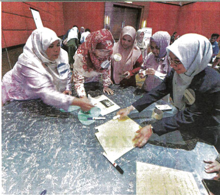
DUTA Kenali Ubat menjalankan aktiviti pada Mesyuarat Pemantapan Duta Kenali Ubat, di Klang baru-baru ini.

AKHBAR : UTUSAN MALAYSIA MUKA SURAT : 25 RUANGAN : DALAM NEGERI GAYA